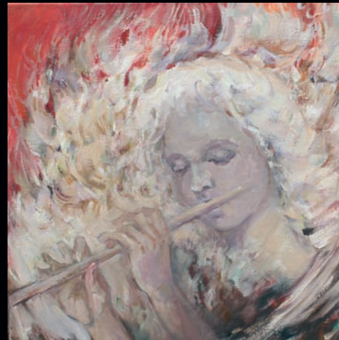
„Weisser Engel“, 60 x 60, Öl, Leinwand, 2006.

Lydia Schigimont Köln www.schigimont-art.de