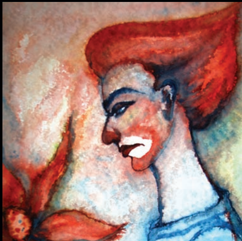
„Identität eines Clowns“, o. R. 43 x 60 cm, Aquarell.

Elke Koch Langerwehe-Hamich www.gemalteimpressionen.de