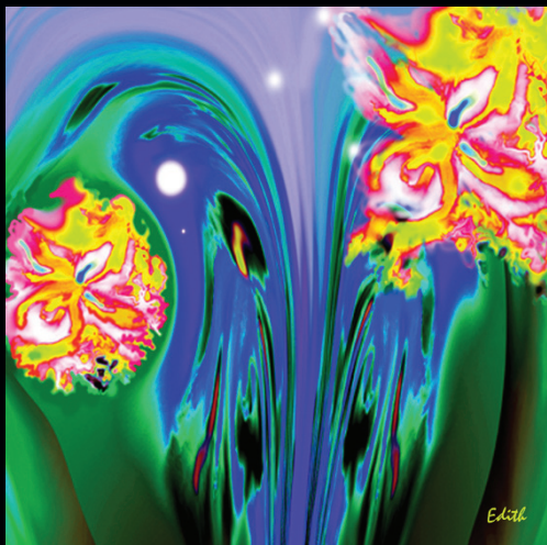
„Elegie“, Computergrafische Malerei, 90x90 cm.